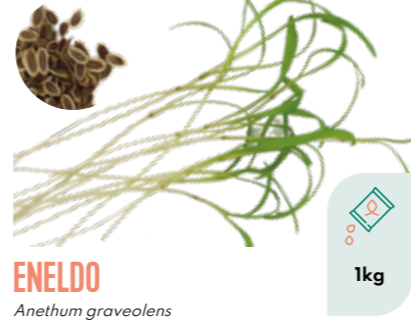
ENELDO Anethum graveolens BIO 1kg