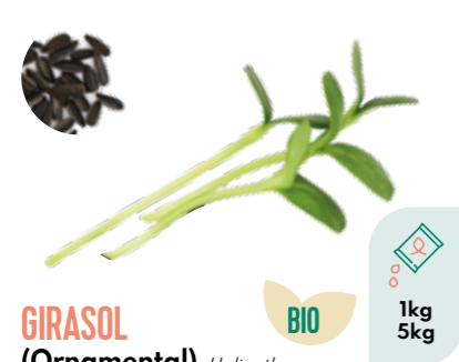
GIRASOL (Ornamental) Helianthus annuus BIO 1kg 5kg