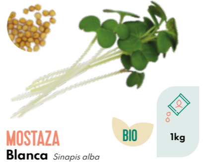
MOSTAZA Blanca Sinapis alba BIO 1kg