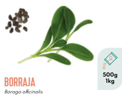
BORRAJA Borago officinalis BIO 500g 1kg