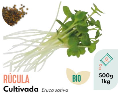
RÚCULA Cultivada Eruca sativa BIO 500g 1kg