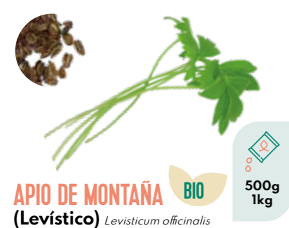
APIO DE MONTAÑA (Levístico) Levisticum officinalis BIO 500g 1kg