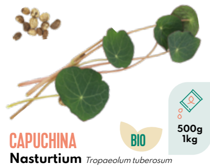
CAPUCHINA Nasturtium Tropaeolum tuberosum BIO 500g 1kg