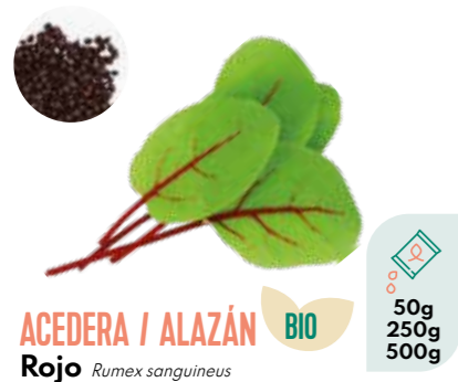
ACEDERA / ALAZÁN Rojo Rumex sanguineus BIO 50g 250g 500g