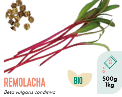
REMOLACHA Beta vulgaris conditiva BIO 500g 1kg