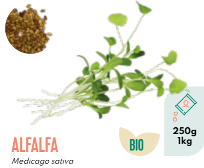
ALFALFA Medicago sativa BIO 250g 1kg