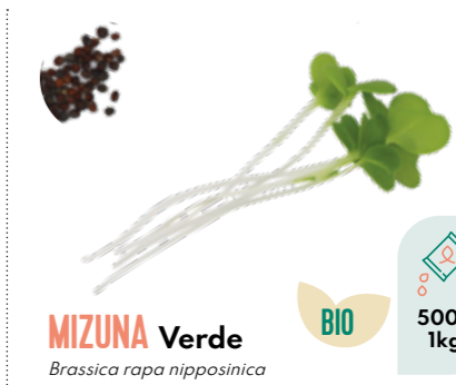
MIZUNA Verde Brassica rapa nipposinica BIO 500g 1kg