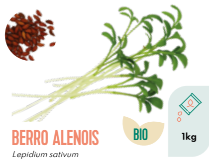
BERRO ALENOIS Lepidium sativum BIO 1kg