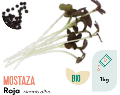
MOSTAZA Roja Sinapis alba BIO 1kg