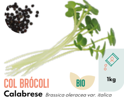
COL BRÓCOLI Calabrese Brassica oleracea var. italica BIO 1kg