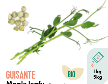
GUISANTE Maple leafy Pisum sativum BIO 1kg 5kg