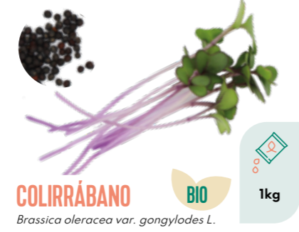
COLIRRÁBANO Brassica oleracea var. gongylodes L. BIO 1kg