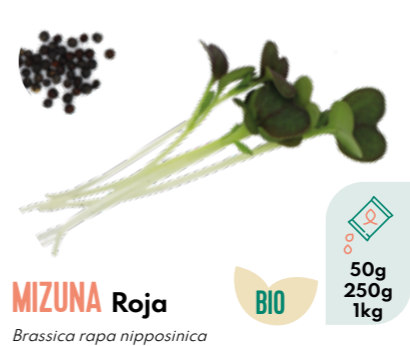
MIZUNA Roja Brassica rapa nipposinica BIO 50g 250g 1kg