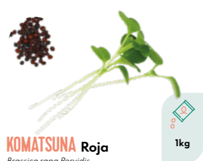
KOMATSUNA Roja Brassica rapa Pervidis BIO 1kg

BIO Semillas ecológicas certificadas por ECOCERT FR-BIO-01 Las semillas no ecológicas no están tratadas