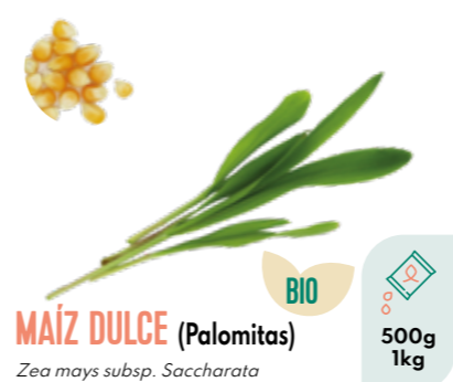
MAÍZ DULCE (Palomitas) Zea mays subsp. Saccharata BIO 500g 1kg