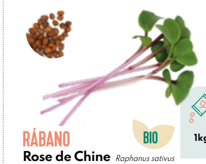
RÁBANO Rose de Chine Raphanus sativus BIO 1kg