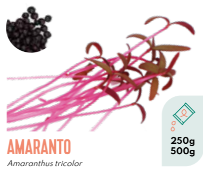
AMARANTO Amaranthus tricolor BIO 250g 500g