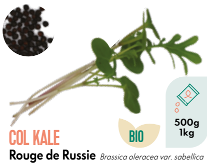
COL KALE Rouge de Russie Brassica oleracea var. sabellica BIO 500g 1kg